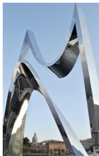
Il monumento "Life Electric"

Anche Confartigianato Imprese di Como ha voluto partecipare e sostenere il progetto "Life Electric" realizzato e donato alla città di Como dall'architetto statunitense di fama mondiale Daniel Libeskind, attraverso l'iniziativa degli "Amici di Como", e che si ispira alla tensione elettrica tra due poli di una batteria, il grande dono di Volta all'umanità, proprio