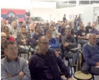
Un momento del seminario

Si è svolto presso La Concessionaria Autovittani di Cantù, un